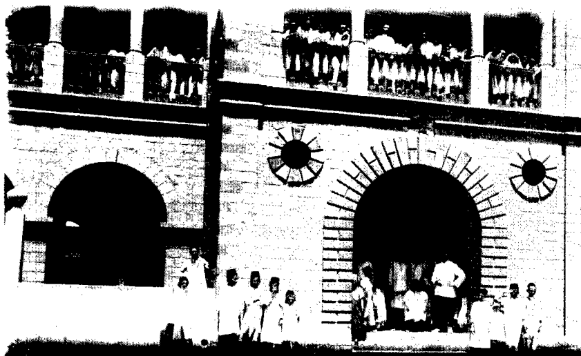
בית־הספר היהודי בעדן, 1921