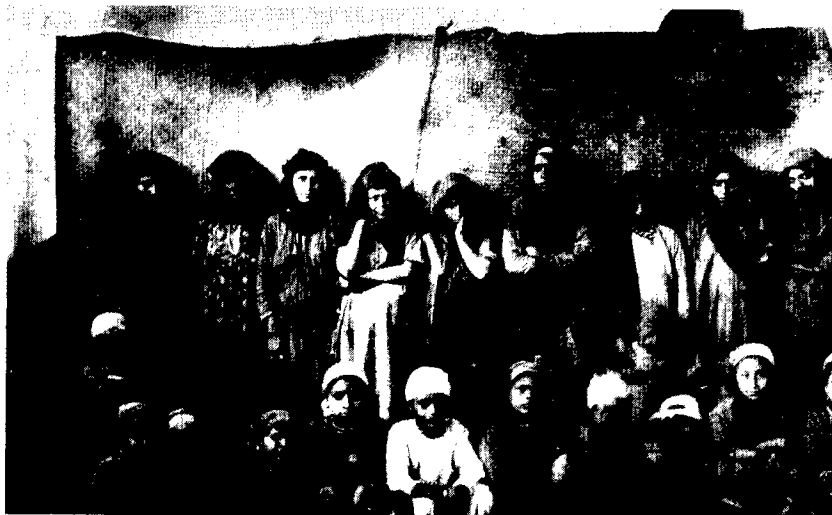
פליטות יהודיות מתימן בעדן

רוב יהודי עדן מתגוררים בכתים שירשו מאבותיהם ולאחרונה עלה מס הבתים לגובה של תשעה אחוזים, שהינו פי ארבעה ויותר מן המס הקודם, שאף הוא היווה נטל כבד על בעלי הבתים.