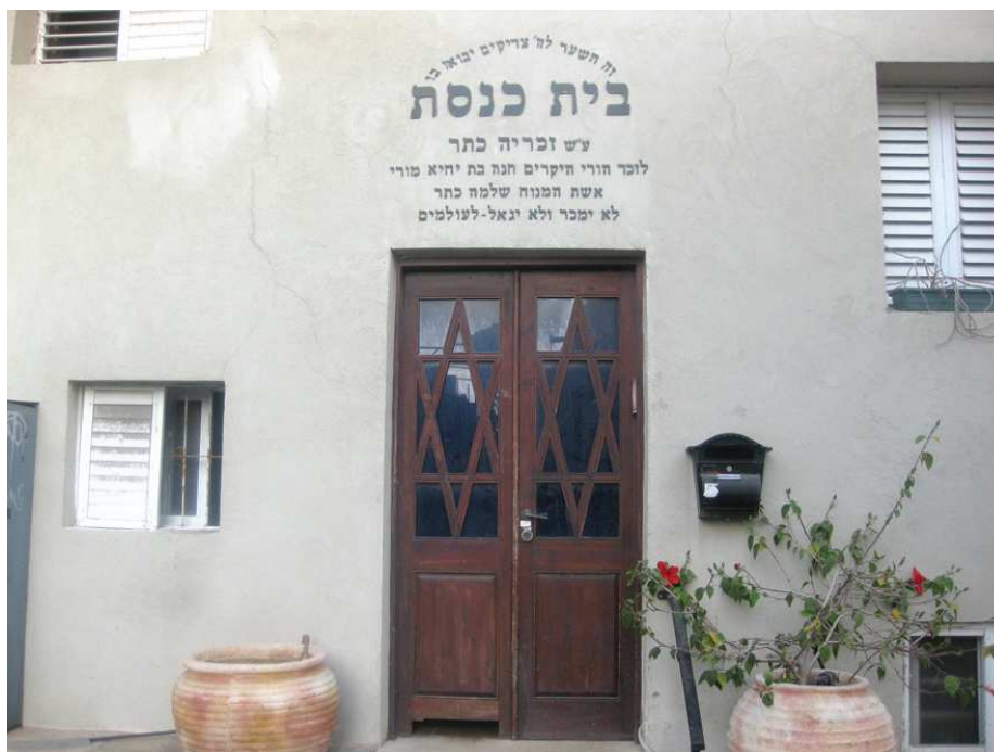
הכניסה לבנין שבאחת מדירותיו שוכן בית הכנסת "אבוסת - כתר"