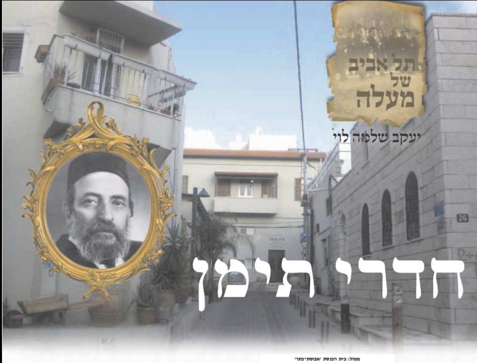
ממול: בית הכנסת 'אבוסית' כתי'