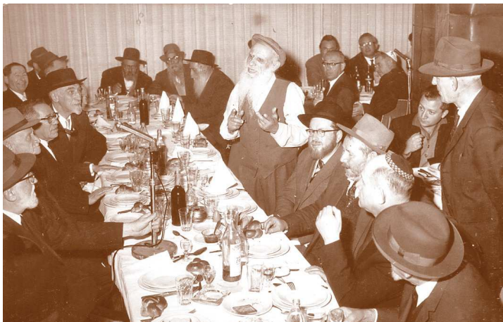
נושא דברים בסעודה של ה"חברא קדישא"