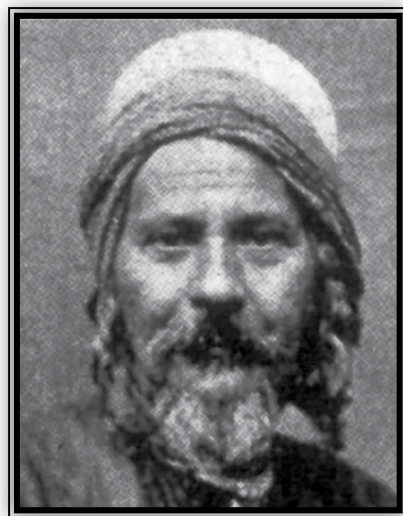
הרב יחיא קאפח