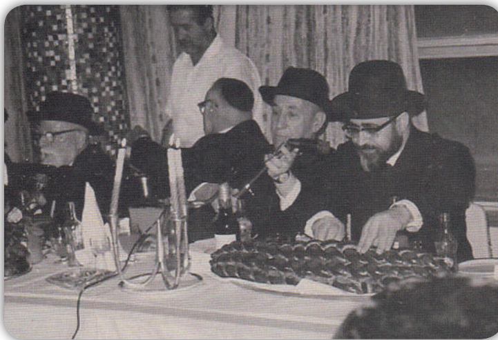
שמעו שמוע אלי ואכלו טוב ותתענג בדשן נפשכם

קשה לדבר על היום המר והנמהר, יום ג' במרחשון תשע"ד, בו כבו המאורות ונסתלק הארי הגדול, מורינו ורבינו עטרת ראשינו רבי עובדיה יוסף זצוקלל"ה. קול ברמה נשמע, וכל עין דמוע תדמע, הקרובים והרחוקים, כי נצחו אראלים את המצוקים, קשה סילוקם של צדיקים.