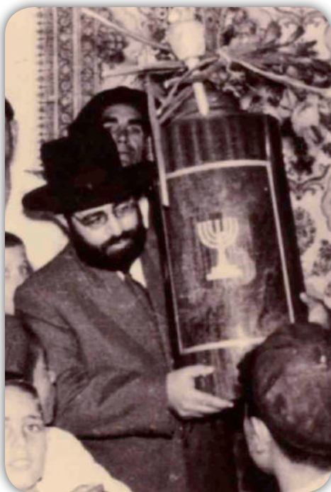
לקח טוב נתתי לכם תורת אל תעזבו

תנן בסנהדרין (צ' ע"א) שלושה מלכים אין להם חלק לעולם הבא, ירבעם אחאב ומנשה. מספרת הגמרא שם (ק"ב ע"ב), רב אשי סיים את הפרק והגיע לעניין שלושה מלכים, אמר, למחר נדרוש בחברינו. [ופירש רש"י שהיו תלמידי חכמים כמותנו, ואין להם חלק לעולם