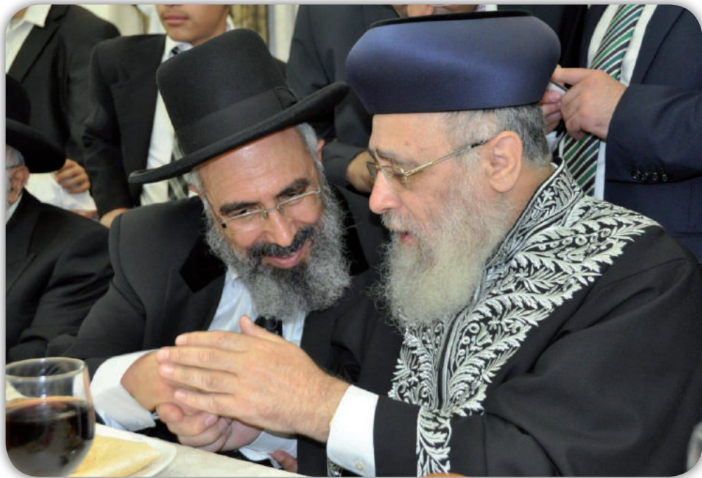
הראשון לציון הרב יצחק יוסף והרב רצון ערוסי

ובזכות המשפט נזכה לגאולה, שנאמר (ישעיה נ"ו א') כה אמר ה', שמרו משפט ועשו צדקה, כי קרובה ישועתי לבוא וצדקתי להגלות. ונאמר (שם א' כ"ז) ציון במשפט תפדה ושביה בצדקה. ובכן, השם חפץ למען צדקו, יגדיל תורה ויאדיר. אמן ואמן.