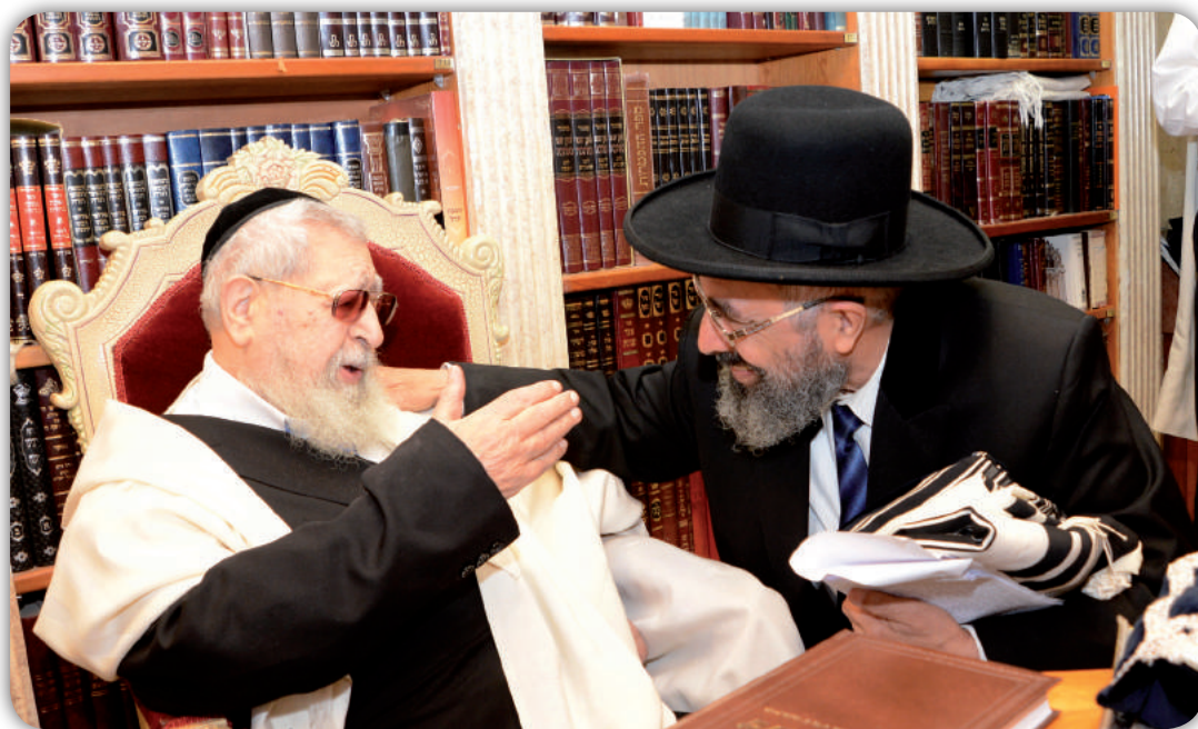
הרב רצון ערוסי ומרן

מצנת התוכחה היא מצוה חשובה, למרות זאת חז"ל הטילו ספק אם יש מי שיודע להוכיח (ערכין ט"ז ע"ב). גם מצנת ההספד היא מצוה חשובה, ובוודאי להספיד גדולי ישראל, אבל ספק גדול אם יש מי שיודע להספיד. וספק עוד יותר גדול, אם יש מי שיודע להספיד גדולי ישראל, כמו מרן הג"ר עובדיה יוסף זצ"ל, כי אנו קטנים בשכלנו מכדי לעמוד על גודל אישיותם.