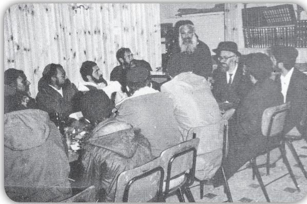
ישיבת מאור חזקיהו, שיעור לבעלי תשובה

שאל אותו הקב"ה מה שמך, היה צריך לענות אני חלק אלוה ממעל, שהרי הנשמה הרוחנית שבתוכו היא העיקר, והגוף שנוצר מן האדמה אינו אלא עטיפה לנשמה. ורק מחמת הנשמה, האדם מורם מכל היקום, נזר הבריאה. אבל הוא השיב, אני עפר מן האדמה, כי על ידי זה לא יבוא לידי גאווה.