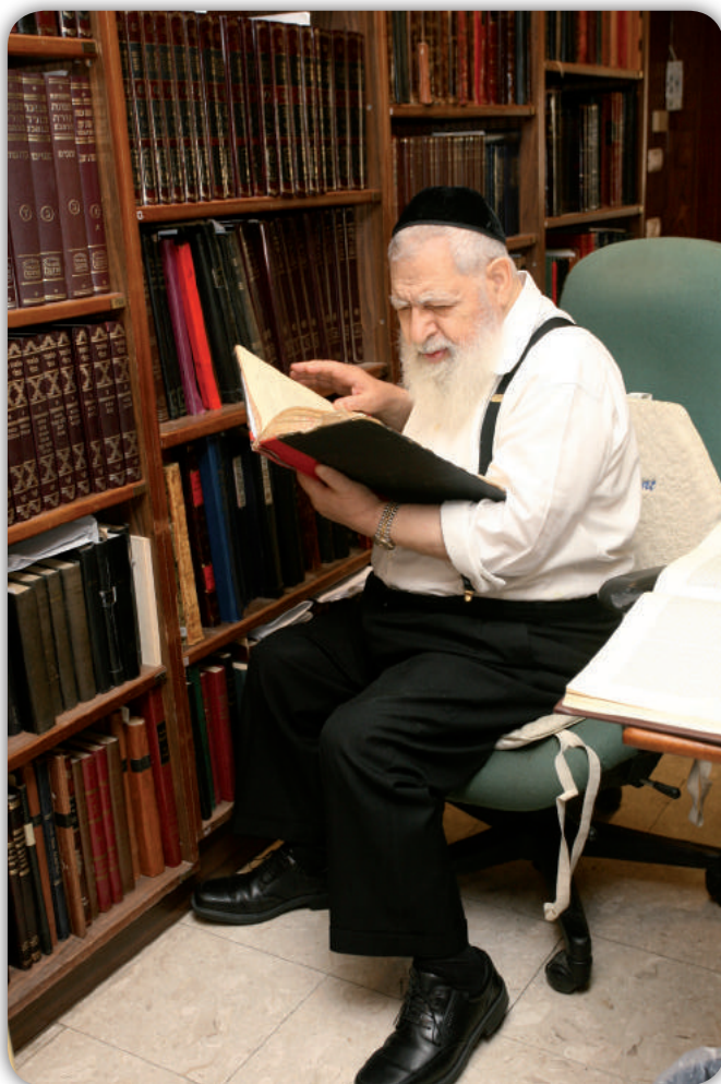
ובתורתו יהגה יומם ולילה

מקומות, שבוע לפני כן. והנה באמצע השיעור עמד אברך אחד, הנראה תלמיד חכם חריף ובקי, ואמר לרב, דברי הרב הם היפך דעת מרן בשולחן ערוך חושן משפט. שאלו הרב, מה אומר מרן, ואותו אברך ציטט מילה במילה את דברי מרן בשולחן ערוך. הרב בענותנותו