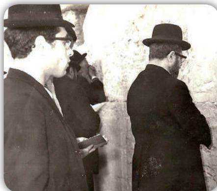
מרן בתפילה בכותל המערבי לאחר בחירתו למשרת ראשון לציון והרב הראשי לישראל מאחוריו בנו הרב יצחק יוסף שליט"א

כשהיה בזמנו מכרז על משרת הרב הראשי לישראל והראשון לציון, היה שולח אותי עם עוד רבנים, כדי להשפיע על רבנים שיתמכו בו. ובס"ד הרב נבחר לכהן פאר במשרה הרמה. זכיתי ונסעתי אתו ועם עוד רבנים, באותו היום, לכותל המערבי, לתפילת מנחה חגיגית ולהודאה לה'. לאחר מכן נסענו אל הרב יוסף שלום אלישיב זצ"ל, לקבל את ברכתו, והרב קיבל אותו במאור פנים מיוחד.