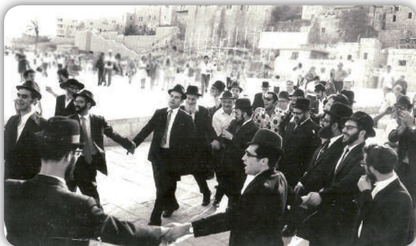
תלמידי מרן בריקודים בכותל המערבי שריד בית מקדשינו לאחר בחירתו

את השיעורים בשעת מעשה, בכמה פנקסים שלמים. לאחר זמן נתבקשתי על ידי אחד מתלמידיו באי ביתו, למסור את הפנקסים, כדי שיעברו על השיעורים שאמר בזמנו.