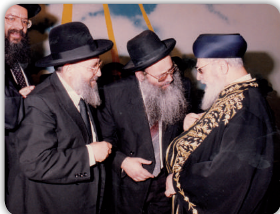
מרן, הרב משה מאיה, הרב שלום צדוק, הרב אריה גמליאל

שלעולם אינו בודד במערכה, וכי רבני ישראל עומדים לצידו ומחזקים את ידיו במפעליו החשובים. מרן מצידו הקפיד להביע את הכרת תודתו, כאשר זיכנו פעם אחר פעם בהשתתפותו בשמחות בני המשפחה, חתונות, בריתות וכו'. באותם אירועים נוצר קשר אמיץ בין מרן לכבוד אבא מארי כמוהר"ר אברהם צדוק זצ"ל, כשכל שיחתם בדברי תורה, ואבא מארי מרצה בפני מרן את ספקותיו בהלכה ואת חידושיו בלימודו, ומרן משיב, מתייחס ומרחיב כיד ה' הטובה עליו, לשמחת לב כל הנוכחים.