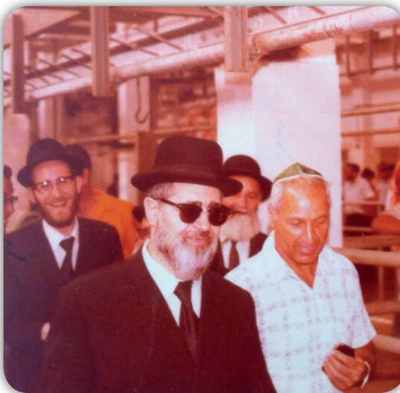
מרן בבואו לבית המטבחים בירושלים