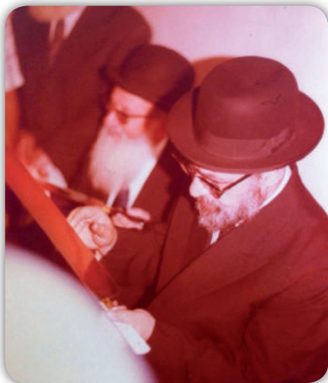
מרן בבדיקת סכין בבית המטבחים