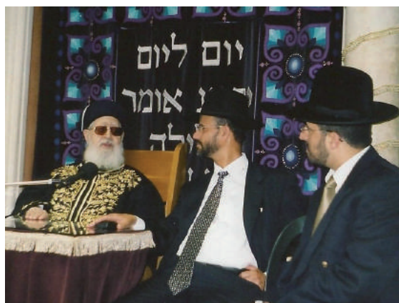
פלוני, הרב חנניה צפר, מרן