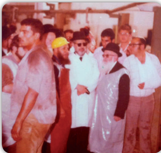
בבית המטבחים בירושלים בשעת השחיטה. במרכז מימין לשמאל: הרב דוד עובדיה, מרן, הרב ששון גרידי