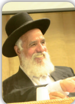
הרב שלמה מחפוד