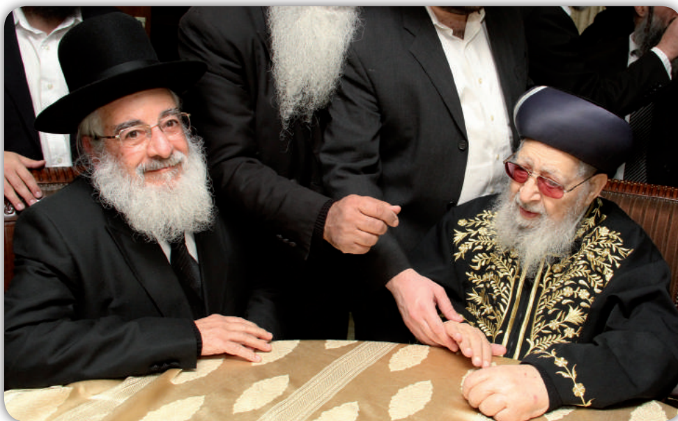
מרן והרב פנחס קורח

מרן היה יחיד בדורו ואף ביחס לכמה דורות שקדמוהו, בחכמתו ובידיעת התורה המקיפה שהיתה בו. מטל ילדותו בוצין בוצין מקטפיה ידע. בעוד שבני גילו היו משתובבים במשובות ילדות, הרי מרן שם כל מעיינו בעמל התורה. בהתמדה עצומה ובעמל רב, הגיע למעלתו המיוחדת בין חכמי הדור. שאיפתו הגדולה למלא כריסו בבקיאות