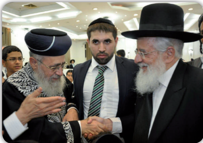
הראשון לציון הרב יצחק יוסף והרב פנחס קורח

זכה מרן ללוויה אשר כמוה לא נהיתה, בהשתתפותם של כמליון אנשים, ובצערם של רבים שבכו בביתם על סלוקו של צדיק וגאון הדור, והשמועה אומרת כי כמאה אלף איש קרעו בגדיהם בעקבות פטירתו.