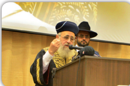
הראשון לציון הרב יצחק יוסף שליט"א