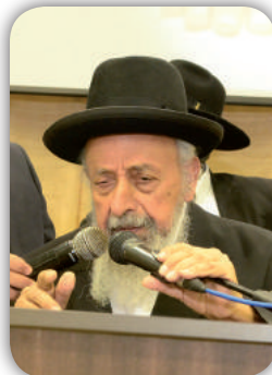
הרב שמעון בעדני