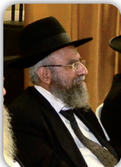
הרב הלל יצחק הלוי