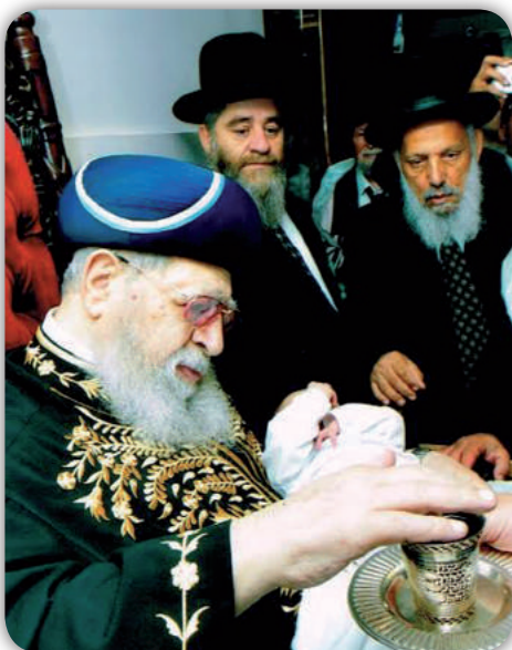
הרב עובדיה יפעי, פלוני, מרן

זכה עם ישראל בארץ הקודש ובתפוצות הגולה, שעל פני מרבד שנות הדורות נתוספה נשמה רבת גוונים, נוצצת וזוהרת, לאור באור החיים. הדור כולו ינק יניקה בלתי פוסקת מאותה נשמה, נשמת כל האומה. וקול המון כקול שדי, אשר היו למאורות, פזורים ברחבי תבל. מי לא ראה את פלא היצירה, בוצינא קדישא, שפעלה בריש גלי, מול הליגה שפעלה בשטח ההפקר של חיינו ושמה לה למטרה להפיל את חומת התורה. וכאן קמה וגם ניצבה בעוז ובגבורה, רוחו של מאור ישראל. פלסה נתיבות, חרשה לבבות והוציאה למרחב עם שלם. העם ההולכים בחושך, ראו אור גדול.