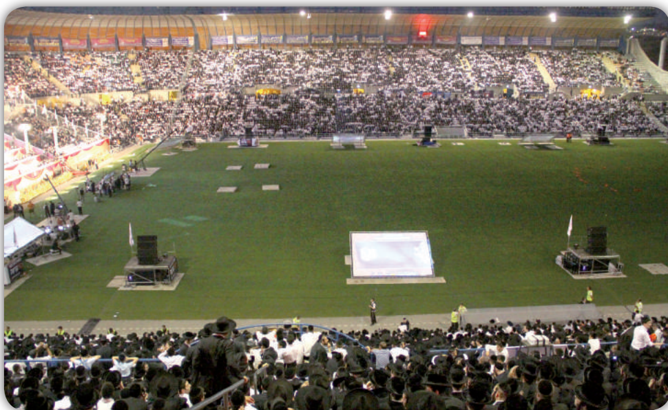
שאי סביב עיניך וראי כולם נקבצו באו לך. הקהל במעמד סיום הש"ס